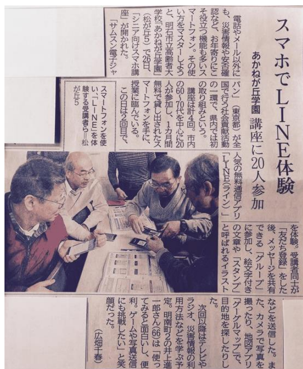
2015-1-27 神戸新聞 朝刊